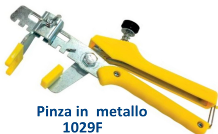
Pinza in metallo 1029F

DC01 = 1,0mm DC15 = 1,5mm DC02 = 2,0mm DC03 = 3,0mm DC04 = 4,0mm