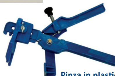
Pinza in plastica 1029

DC01 = 1,0mm DC15 = 1,5mm DC02 = 2,0mm DC03 = 3,0mm DC04 = 4,0mm