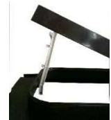
apertura con 3 posizioni di fermo