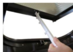
apertura per la ventilazione con 3 posizioni di fermo